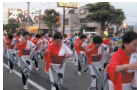
踊りパレードに参加する女性部の皆さん