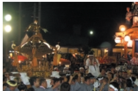
青年部による商工みこし

牛久スタンプ会40周年 イベントのお知らせ 当会は、おかげさまで40周 年を迎えることとなりました。 日頃のご愛顧に感謝して、 スペシャルイベントを開催し ます。