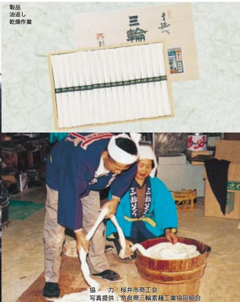
製品 油返し 乾燥作業