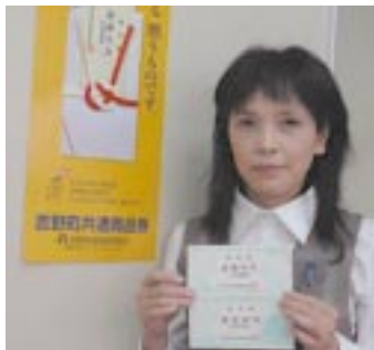
吉野町商工会のプレミアム付き商品券

さる6月23日(火)、川上村迫の「ホテル杉の湯」で、吉野地区商工会広域協議会(中井神一会長)が第2回優良従業員表彰式を開催し、吉野地区管内13事業所の27名を表彰した。 当日、午後1時30分から開始された式典には、大谷一川上村長、国中憲治県議会議員らが来賓として臨席。県連からは、久保純一県連会長らが出席した。