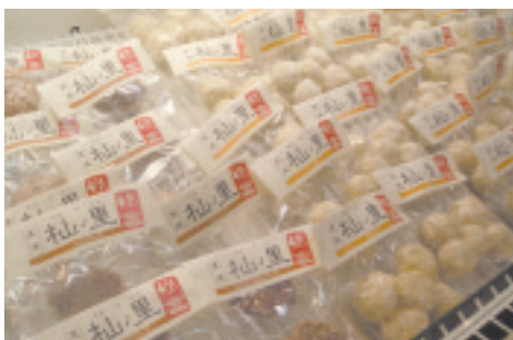
「萩ノ里」シリーズのハンバーグ(左)とコロッケ(右)

黒滝村商工会は、当地で行われている、全国的にはほとんど見られない「食肉用のイノシシの飼育」が行われていることと、イノシシ