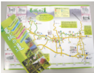
「葛城の道」ルートマップ

御所市商工会は、現在ある「葛城山」「葛城の道」周辺の神社仏閣を巡る観光ルート来訪者のさらなる増加とそれら来訪者に「御所まち」を巡るきっかけづくりや意識の高揚を行うことにより、周辺散策ルート来訪者と来街者の相互交流を図り、「周辺散策ルート」御所まち「相互の観光的發展を目的とした。