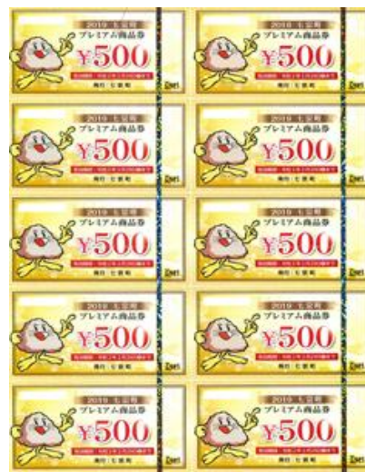
七宗町プレミアム付商品券