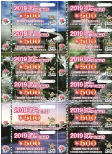
レッキープレミアム商品券

今年度は「レッキープレミアム商品券」とは別に、「七宗町プレミアム付商品券」も発行されています。それぞれに使用期限が異なりますので、しっかり確認いただき、お客様にもお声かけをお願いします。