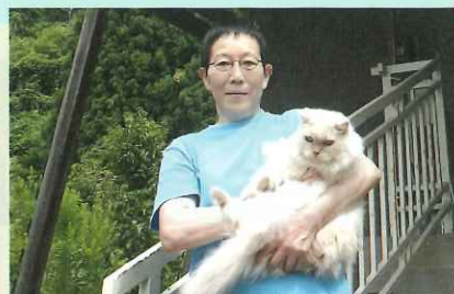
からだづくり すたじお ま〜る (入広瀬商工会) 〒946-0304 魚沼市穴沢1136-5 携帯 090-7193-3136 URL https://karadatsukuri-studio-maaru.jimdo.com/ 営業は完全予約制。電話にて曜日時間をご相談。