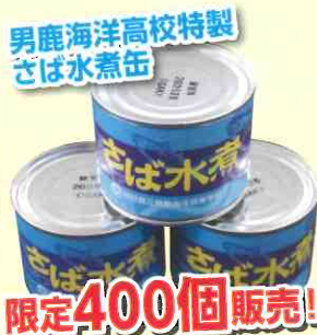
男鹿海洋高校特製 さば水煮缶