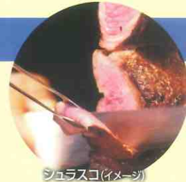
シュラスコ(イメージ)