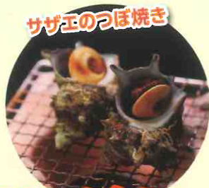
サゲ玉のつば焼き