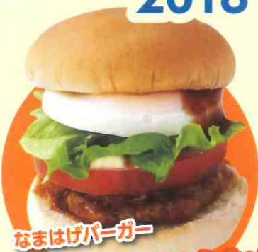
なまはげバーガー

開催場所 男鹿駅および道の駅おが「オガーレ」周辺 開催時間 10:00～16:00