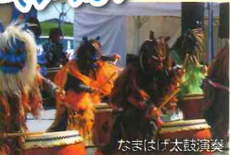
なまはげ太鼓演奏