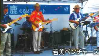
若美ベンチャーズ