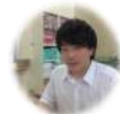
平成29年度採用 道東地区商工会 記帳指導職員

これから学ぶべきことは山ほどありますが、会員や先輩の方々に教えていただき町や商工会のためにがんばっていきたいです。