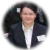
平成28年度採用 道東地区商工会 記帳指導職員

商工会の仕事はつなぐことなのではないかと考えます。それは、事業であり、人であり、地域であつたりしますが、その分仕事は多岐にわたり、今は経験も少なく失敗をすることもあります。今後は、仕事への理解を深めて商工会・町の役に立てるよう毎日がんばり自分が今いる場所をいろいろな人に発信できるようになりたいです。