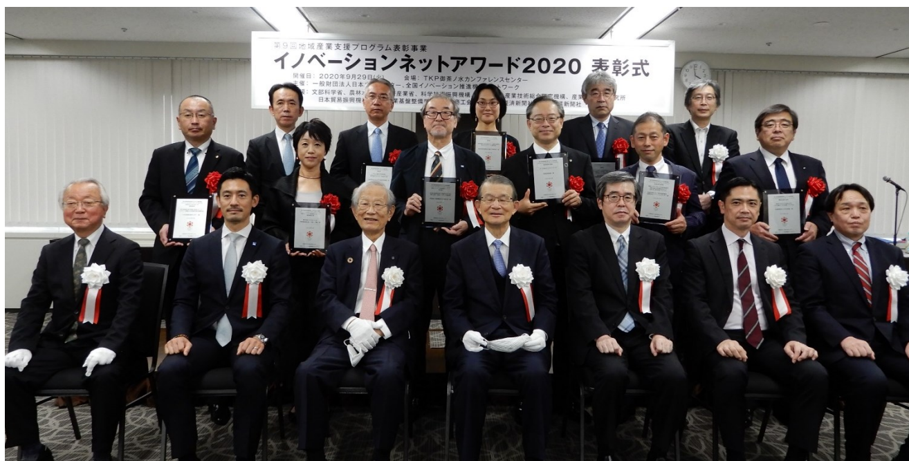
イノベーションネットアワード2020表彰式での記念撮影 (記念撮影時のみ、マスクを外しております)

地域の中小企業による新事業および新産業創出などを促進し、地域産業の振興・活性化に優れた成果を上げている「地域産業支援プログラム」を表彰します。