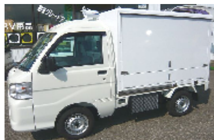
ダイハツ ハイゼット