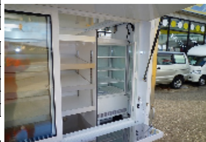
冷蔵ショーケース (オプション品)