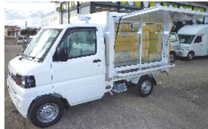
日産 クリッパー 三菱 ミニキャブ 上下跳ね上げ扉