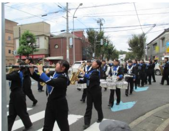
マーチングパレード

9月14日（金）から16日（日）にかけて恒例の内野まつりが開催されました。15日（土）の行事は一部雨天のために残念ながら中止となりましたが、その他の予定行事は無事に実施されました。ご協力を頂きました皆様、大変ありがとうございました。