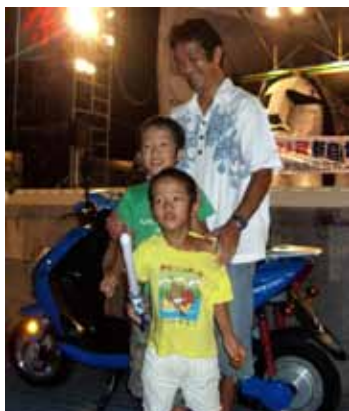
②特等「電動スクーター」

大抽選会は景品総額100万円(東京都元氣が出る商店街事業補助金一部利用)の抽選券には抽選番号の掲載の「うちわ」が配布された。今年の景品コンセプトはアウトドアという事で、特等の「電動スクーター(写真②)」をはじめ「電動自転車」「サー